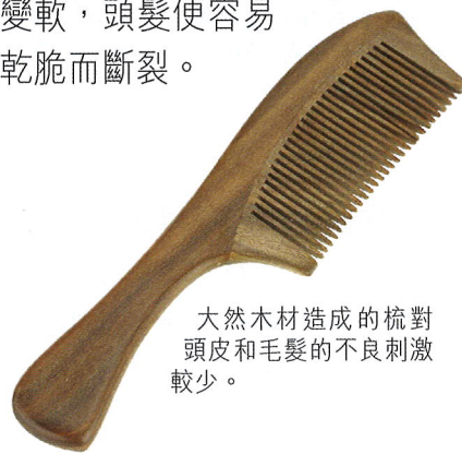
天然木材造成的梳對頭皮和毛髮的不良刺激較少。

皮產生不良刺激，增加對頭髮的牽拉力和摩擦力，尤其是乾性的頭髮，最好使用木梳或牛骨梳。任何強度的輻射均可直接令毛囊受損，導致脫髮。直接照射紫外光會令頭髮的角蛋白斷裂，以致頭髮變得脆弱。用熱風吹燙頭髮會減少頭髮水份的含量，同時令角蛋白變軟，頭髮便容易變乾脆而斷裂。